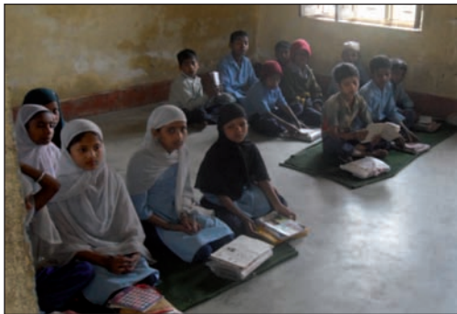
Salle de classe de l'école de Biratnagar. Sans mobilier...

- Financement d'équipements mobiliers (Tables, bancs, tableaux, etc.) pour l'Ecole Privée de Biratnagar (250 élèves appartenant aux 3 communautés religieuses du Népal : Hindouistes, Bouddhistes et Musulmans). Coût prévisionnel : 1392 €.