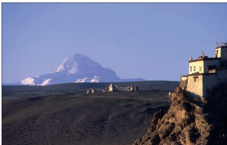
Monastère et Mont Kailash au Tibet

« L'envoûtement du Pays des Neiges, ce ne sont pas ses montagnes ensorcelantes, ses arcs-en-ciel qui défient la beauté, c'est l'alchimie subtile entre l'air épuré des 4000 et l'esprit qui anime les Tibétains, chez qui chaque respiration est une prière, Oum mani padme oum, « Joyau dans le cœur du lotus, salut »... Au petit matin, au bord du lac Manasarovar, le sentiment très fort d'une expérience unique, la « précieuse montagne enneigée devant soi, en plein coeur (Le Mont Kailash). C'est un lieu d'une rare beauté sauvage,