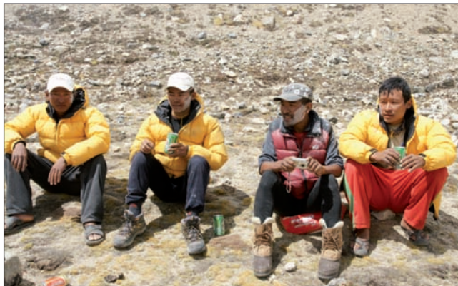
Sherpas d'altitude au camp de base du Shishapangma (Tibet)

Après un peu plus d'une année de fonctionnement, je vous dois un premier bilan moral, que je qualifierai de très prometteur. Au 31 décembre 2010, notre association compte 154 membres, répartis sur toute la France, unis dans le même élan altruiste visant à aider les populations nécessiteuses du Népal, particulièrement la communauté Sherpa et les enfants népalais.