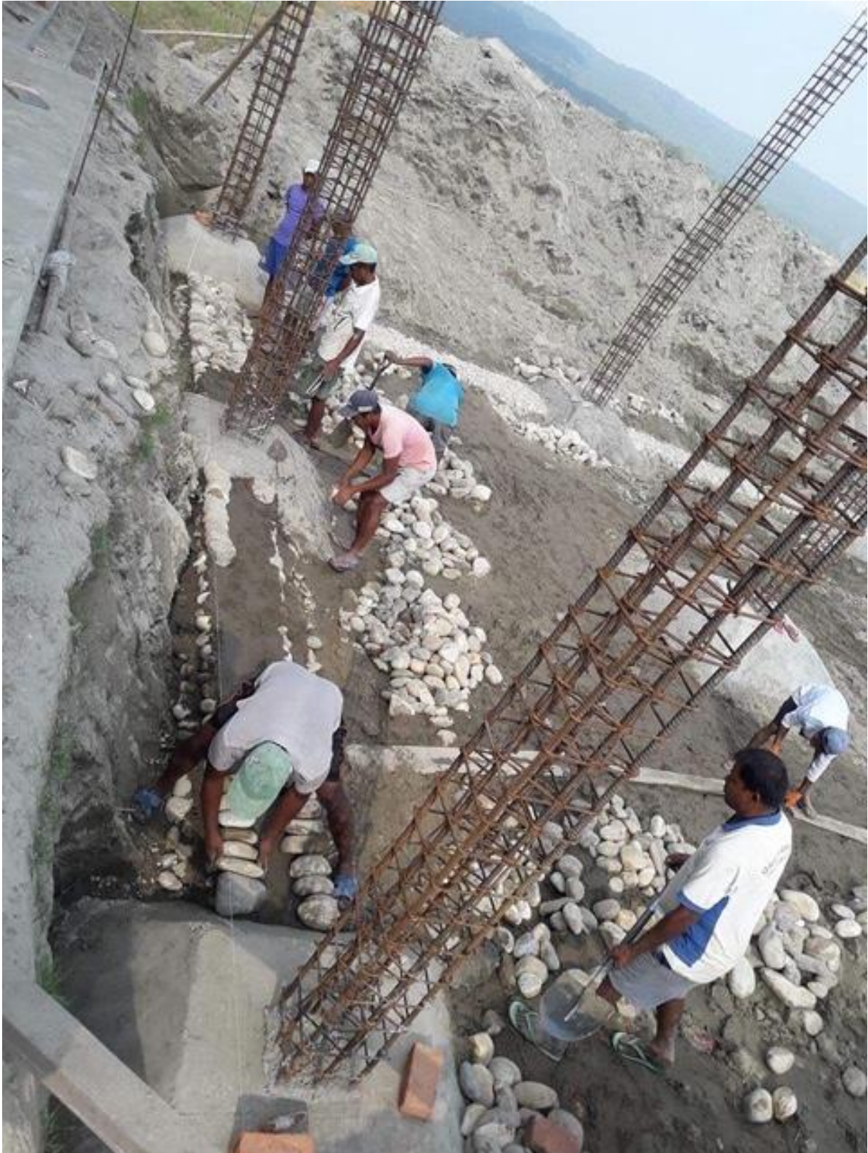
Ca y est, les travaux ont débuté.