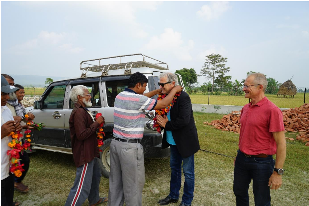
Accueil des autorités villageoises en octobre 2019.