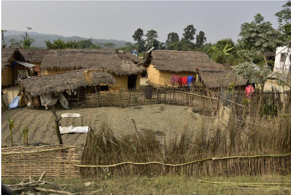
Village de Madi.©