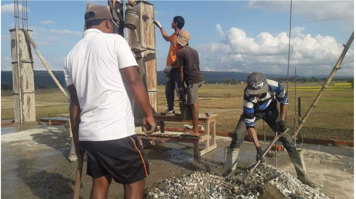
Les ouvriers népalais à la tâche.