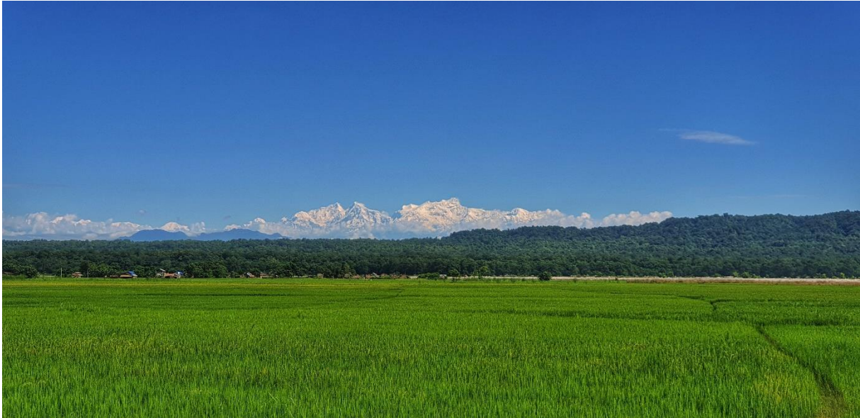
Vue d'une partie du terrain dédié à la construction du Collège, actuellement cultivé en rizière.