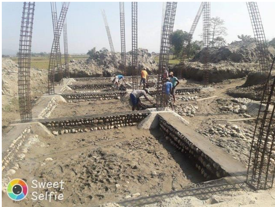
Début des fondations.