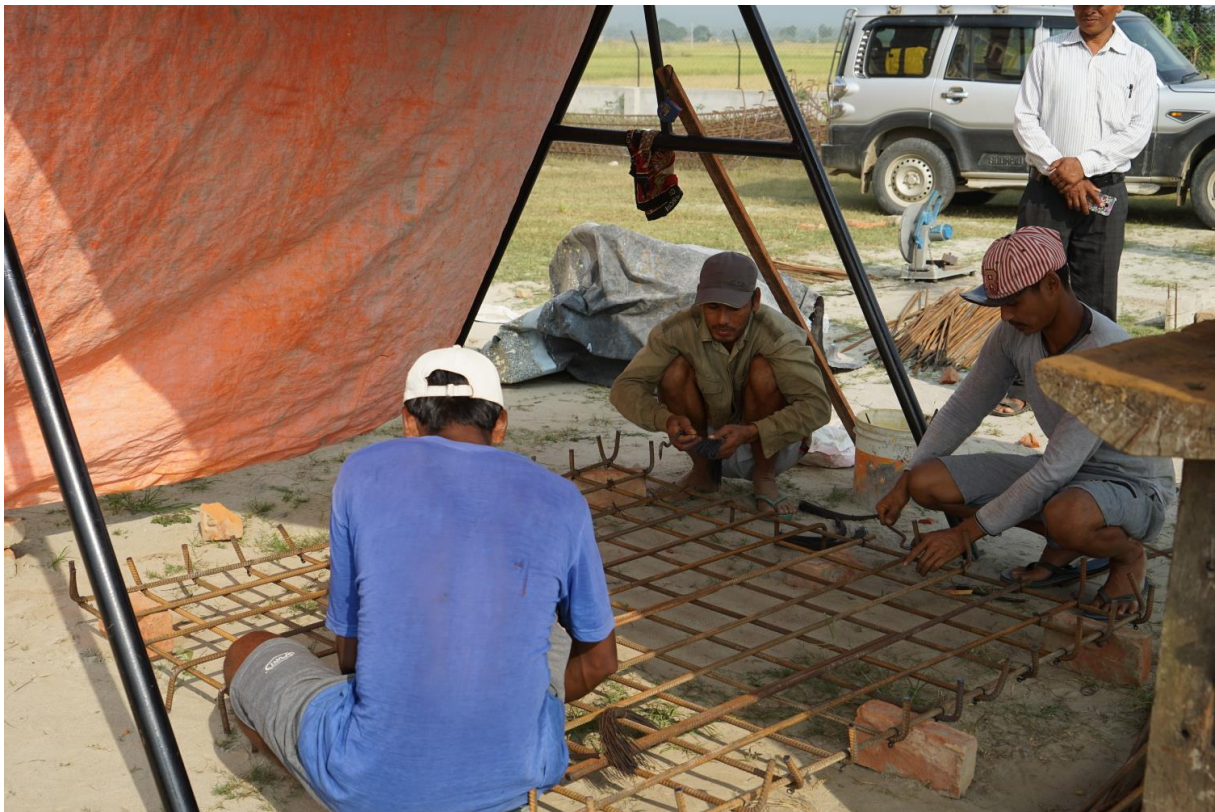
Préparation des treillages en fer de consolidation de toutes les parties cimentées selon les nouvelles normes imposées depuis les séismes de 2015.