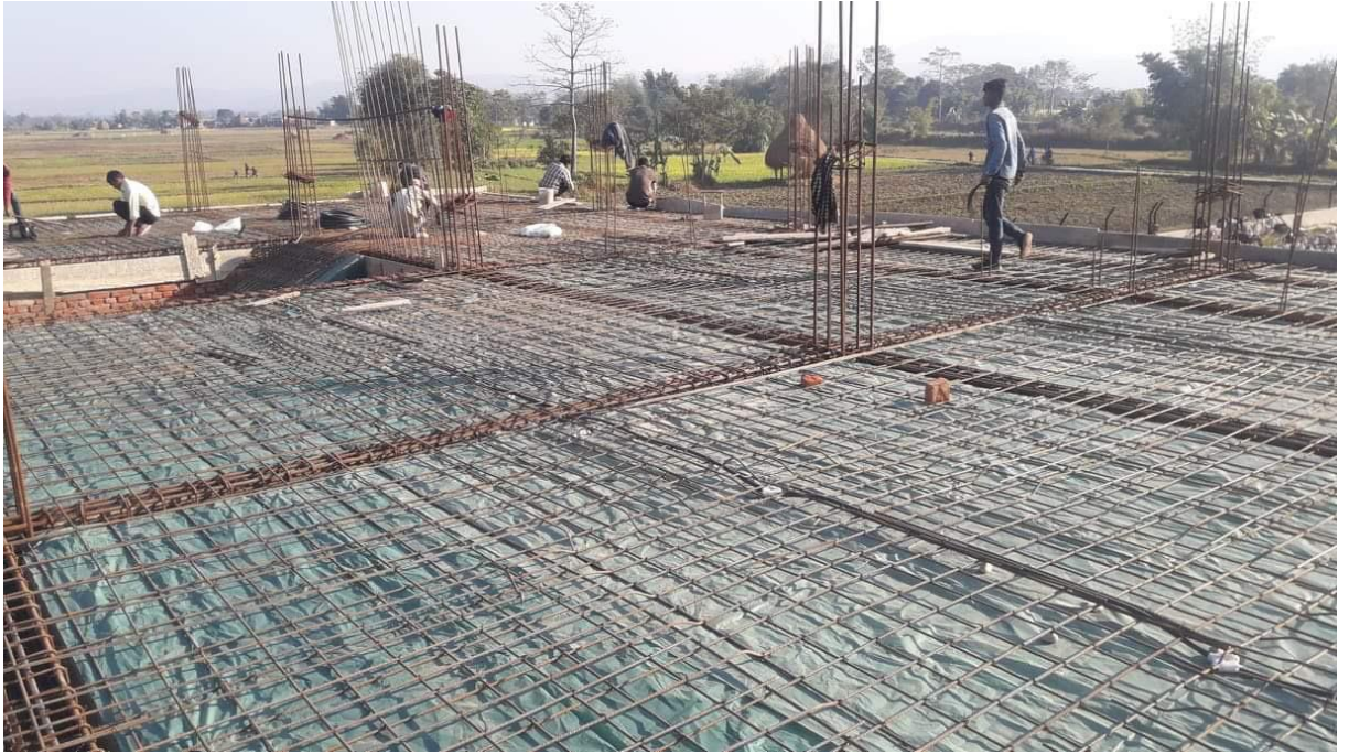
Coulage de la dalle du 1 er étage.