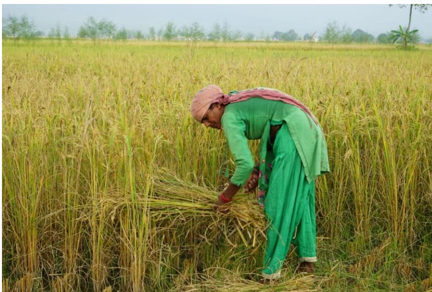
Le quotidien, hors mousson, des habitants de la Province de Madi. La culture du riz, leur seul et unique moyen de subsistance.

Bon an mal an, les villageois ont réussi à construire un bâtiment de 5 classes, butant malheureusement sur un manque de moyens financiers pour construire les 6 classes nécessaires supplémentaires à l'accueil des 200 enfants initialement scolarisés, mais dont bon nombre souhaitent continuer leur scolarité à l'échelon supérieur, c'est-à-dire jusqu'au Collège (Grade 5, 6, 7 et 8 correspondant chez nous de la 6 ème à la troisième). Cette extension tenait particulièrement à cœur aux décideurs locaux (Comité villageois et Comité d'éducation), mais surtout aux parents qui voyaient dans ce projet d'extension, la possibilité de faire franchir à leurs enfants une étape supplémentaire dans leur éducation scolaire, ainsi leur donner de meilleures chances dans la vie.