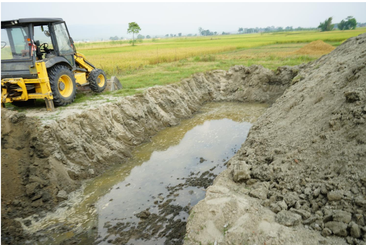
L'instant tant attendu ! La pelleuse commence le début des fondations.

Montagne et Partage, sans préjuger des inévitables retards pris, inhérents au Népal, prévoit un achèvement des travaux à la fin du printemps 2020.