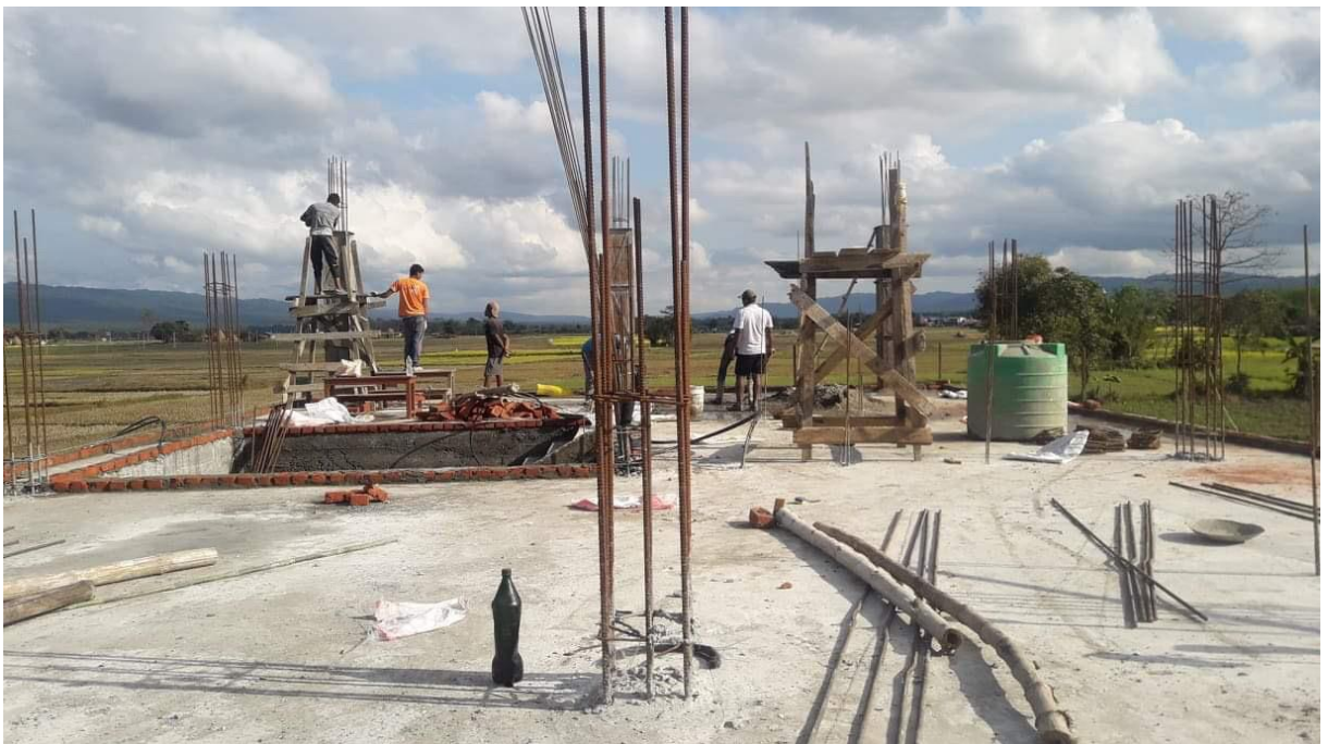
Après la dalle du 1 er étage, les ouvriers continue la construction dans le respect strict des normes parasismiques.