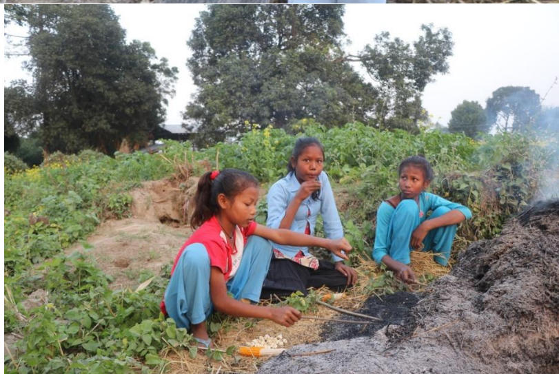
Enfants de Ratni. Le projet de construction de l'École secondaire de la Shree National Basic School de Ratni est pour eux. Soutenez-nous.