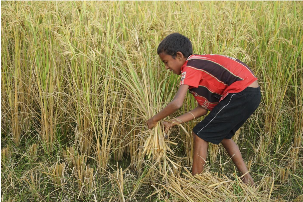
L'avenir réservé aux enfants ne continuant pas leurs études à minima jusqu'en 3 ème .