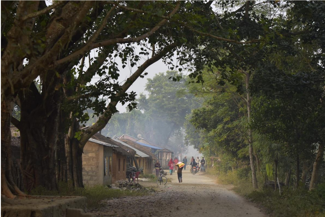
Traversée d'un village de la Province de Bharatpur.

d'abandonner le site initial de l'école pour le transférer dans un endroit surélevé plus sûr, sur un terrain offert à sa mort à la communauté par un généreux donateur Krishna Bandhu Piya.